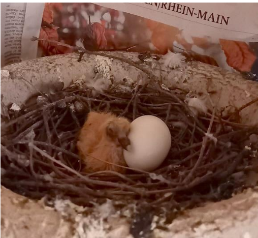
Taubenküken mit „Gips-Geschwister“

In den Taubenhäusern werden täglich artgerechtes Körnerfutter und Wasser für die Tauben bereitgestellt. Dort abgelegte Eier (1 von 2) werden gegen Ei-Attrappen (Gipseier) ausgetauscht. Diese Arbeiten werden von einem Taubenwart-Team auf Minijob Basis des Tierheims Hanau sehr zuverlässig erledigt.