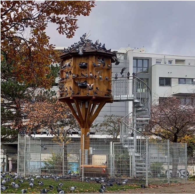
Taubenhaus am Kanaltorplatz

Nach wie vor ist das Taubenhaus am Hanauer Hafen ein voller Erfolg und hat großen Anteil an der nachhaltigen und tierschutzgerechten Reduktion der Hanauer Stadttaubenpopulation! In Zusammenarbeit mit der Stadt Hanau und dem Tierschutzverein Hanau und Umgebung e. V. entstand im Jahr 2022 am Kanaltorplatz ein weiteres Taubenhaus, sodass Nistmöglichkeiten zusammengerechnet auf ca. 100 Taubenpaare erhöht wurden.