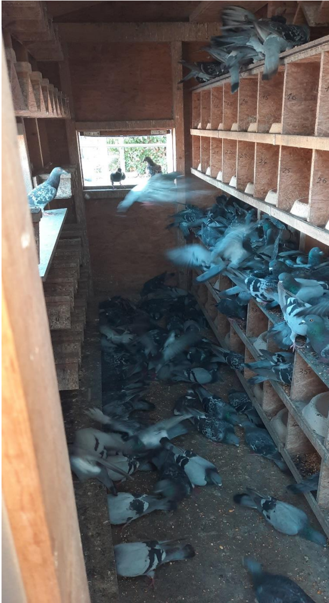
Fütterung im Taubenhaus am Hafen

Es wurden im Jahr 2023 von unseren Mitarbeitern insg. 91 Eier ausgetauscht, 30 Eier waren zerstört und 43 Küken sind verstorben. D. h. insgesamt sind 121 Eier nicht ausgebrütet worden und die verstorbenen Küken konnten sich nicht fortpflanzen. Legt man zugrunde, dass eine Taube im Jahr ca. 9 (teilweise sogar mehr) Gelege a' 2 Eier produziert, ergeben sich daraus 2178 nicht geborene Tauben! Die zerstörten Eier und getöteten Küken sind hier nicht mitgezählt!