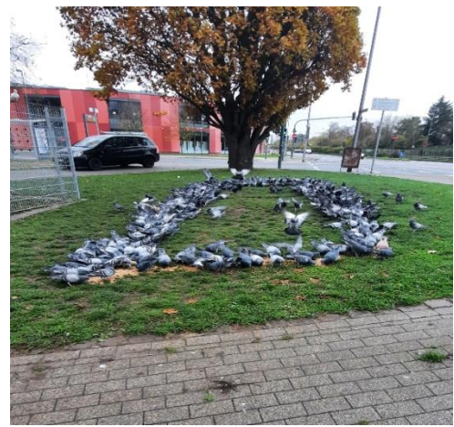
Fütterung am Kanaltorplatz