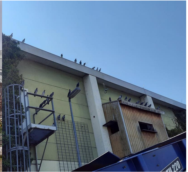
Taubenhaus am Hafen

In den Taubenhäusern werden täglich artgerechtes Körnerfutter und Wasser für die Tauben bereitgestellt. Dort abgelegte Eier (1 von 2) werden gegen Ei-Attrappen (Gipseier) ausgetauscht. Diese Arbeiten werden von einem Taubenwart-Team auf Minijob Basis des Tierheims Hanau sehr zuverlässig erledigt.